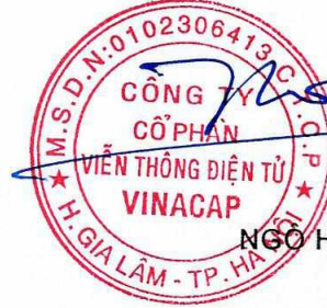
NGO HOÀNG PHƯƠNG

TM. ĐẠI HỘI ĐỒNG CỔ ĐÔNG CHỦ TỌA ĐẠI HỘI